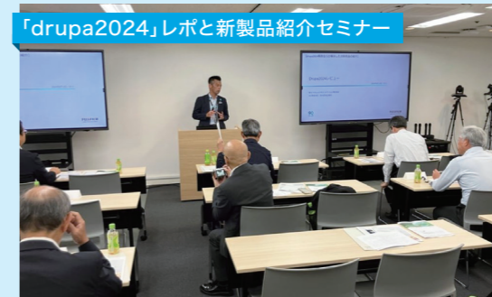
「drupa2024」レポと新製品紹介セミナー

激変の時代の中、メーカーとプリントプロバイダーとの積極的な協力関係を今後も継続できれば幸いです。