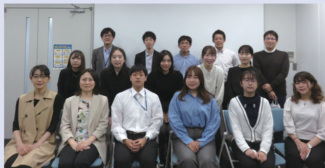
昨年度御参加の皆様