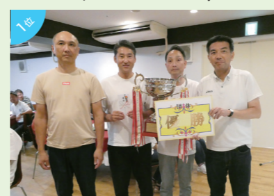
団体優勝 (株)田村コピー