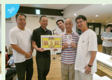
団体3位 リコージャパン(株)