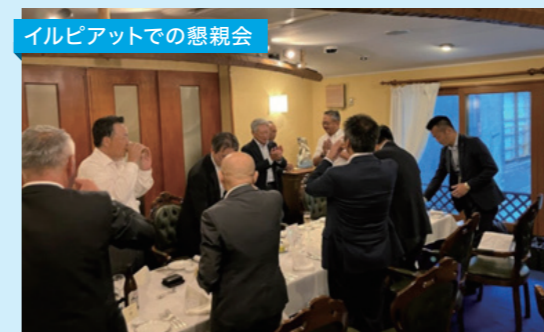
イルピアットでの懇親会