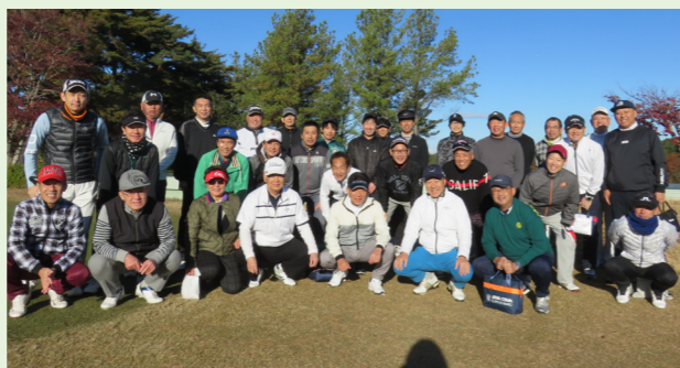
昨年度御参加の皆様