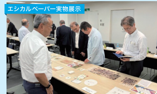
エシカルペーパー実物展示