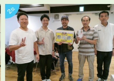
団体準優勝 富士フィルムビジネスイノベーションジャパン(株)